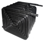
Low maintenance condenser / Condensador de bajo mantenimiento.