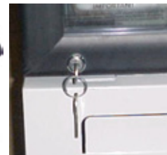
Door Lock System / Cerradura con Llave