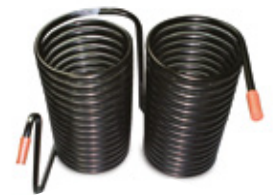
Low maintenance condenser / Condensador de Bajo Mantenimiento.