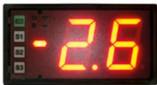
Electronic control with energy saving button and three different temperature range settings / Control electrónico con botón ahorrador de energía, y tres diferentes rangos de temperatura de operación.