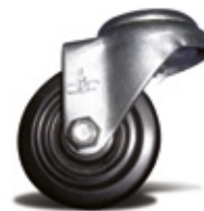
Casters / Rodos