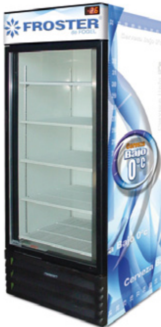
Shown with 5 shelves / Mostrada con 5 parrillas

The largest bottom mount FROSTER® with heated flat glass door and R 290 hydrocarbon refrigerant gas/ Equipo FROSTER® de alta capacidad, de puerta de vidrio térmico, para el piso de ventas, con refrigerante hidrocarburo R 290.