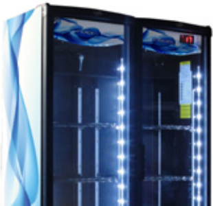
Shown with optional LED Illumination Strips / Mostrado con tiras de iluminación LED opcionales.