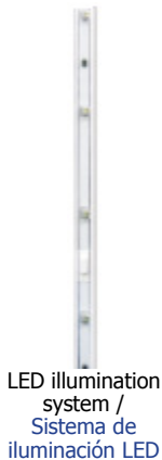
LED illumination system / Sistema de iluminación LED