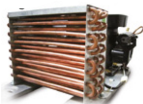
Forced-air condenser / Condensador de aire forzado.